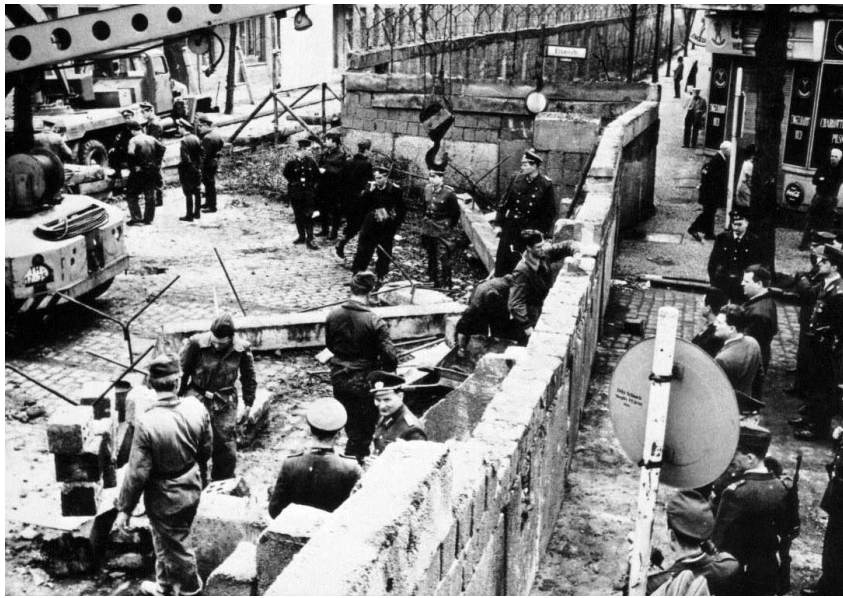
08.13 東ドイツは西ベルリンを包囲する壁を構築。 1990年に東西ドイツが統一されるまで、冷戦の象徴として存在することに。