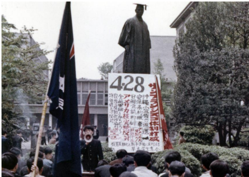
04.28 大学構内では、スピーカーを使つての「学生集会」なるものが常態化していた。