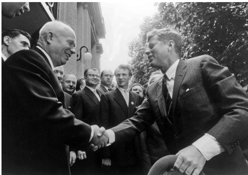
06.03 ケネディとフルシチョフがウィーンで会談。米国は西ベルリンからの撤退を拒否、これを受けてソ連・東ドイツはベルリンの壁構築へ動き出した。