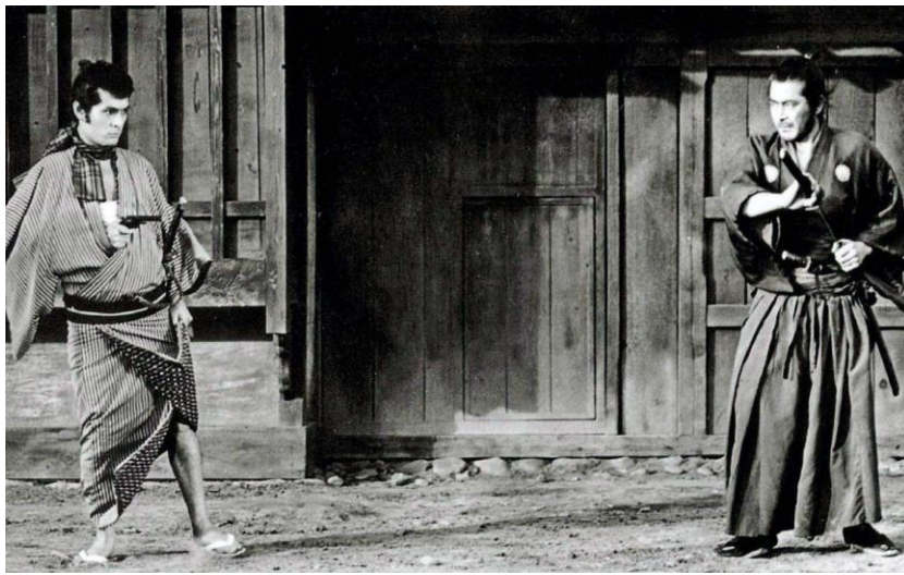
04.25 黒沢明の「用心棒」が公開された。徹底的に面白い時代劇、しかし一つの画面構図に黒沢のこだわりが窺われた。