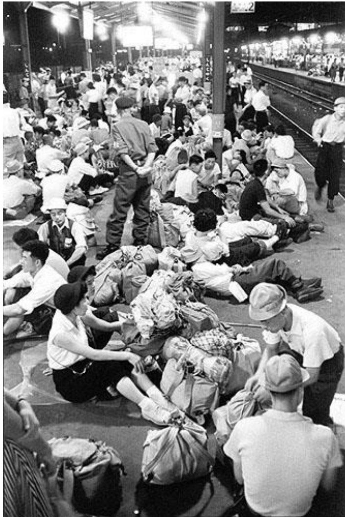
第一次登山ブームの真っ只中。新宿駅集合の場合には、駅ホームで待たされるその前に駅地下道でも待たされた。