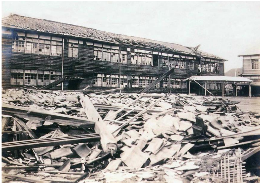
09.16 第二室戸台風(国際名 : Nancy)が大坂湾岸地区に大被害をもたらした。 瞬間最大風速は60m以上で風速計の針が振り切れた。