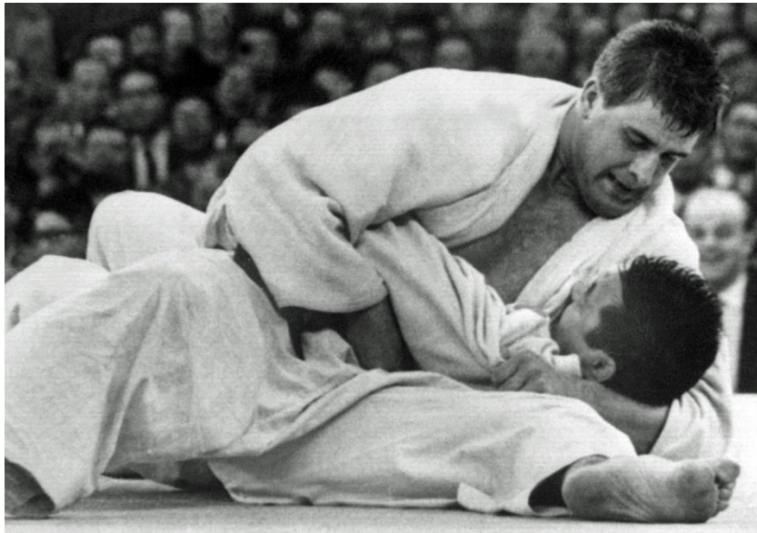
12.03 世界柔道選手権でアントン・ヘーシングが曾根泰治を破って優勝。凱旋帰国したヘーシングを30万人の人々が迎えた。